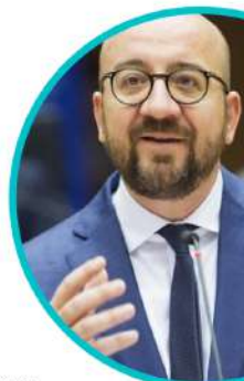
CHARLES MICHEL Presidente del Parlamento Europeo

La transformación digital no se contraponen al desarrollo económico. Podemos transformar nuestra economía para que preserve los recursos naturales y sea de naturaleza circular.