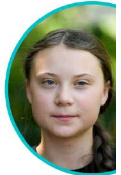
GRETA THUNBERG Activista por el clima

El futuro, y todo lo que hemos conseguido en el pasado, está en vuestras manos. Pero no es demasiado tarde para actuar. Os pido que os despertéis e implementéis los cambios necesarios.