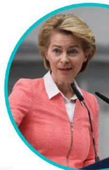
URSULA VON DER LEYEN Presidenta de la Comisión Europea

Reconciliar la manera en la que producimos y consumimos con nuestro planeta. Por eso, el Pacto Verde Europeo busca reducir las emisiones, pero también crear trabajos e impulsar la innovación.