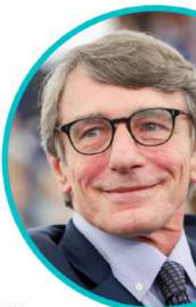
DAVID SASSOLI Presidente del Parlamento Europeo

No somos iguales ante el cambio climático. El hecho de ser ricos o pobres, ancianos o jóvenes, vivir en una zona u otra, tiene un impacto en cómo nos afecta el cambio climático.