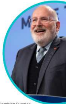
FRANS TIMMERMANS Vicepresidente primero de la Comisión Europea

El Pacto Verde Europeo debe encaminar a Europa hacia un futuro sostenible, asegurar que todos los europeos estén incluidos y que nadie se quede atrás.