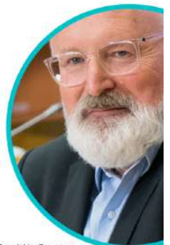
FRANS TIMMERMANS Vicepresidente primero de la Comisión Europea

Debemos buscar en la Política Agrícola Común la forma de garantizar el futuro de los granjeros y de producir alimentos que no contaminen.