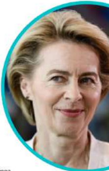
URSULA VON DER LEYEN Presidenta de la Comisión Europea

Por eso, una parte crucial del Pacto Verde Europeo es el Mecanismo de Transición Justa. Movilizaremos 100 billones de euros para destinarlos a las regiones y a los sectores más vulnerables.